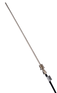
Capteur d'immersion. (option), également disponible pour installation en applique