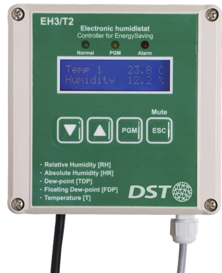
EH3 T2 avec affichage rétro-éclairé, uniquement disponible chez Seibu Giken DST

Deux contacts à fermeture: Sur chaque relais, vous choisissez un des quatre paramètres à régler. Vous pouvez ainsi contrôler un déshumidificateur d'air en deux étages ou contrôler deux déshumidificateurs indépendants. Ou bien vous pouvez utiliser un des relais pour contrôler la déshumidification et l'autre relais pour contrôler la température.