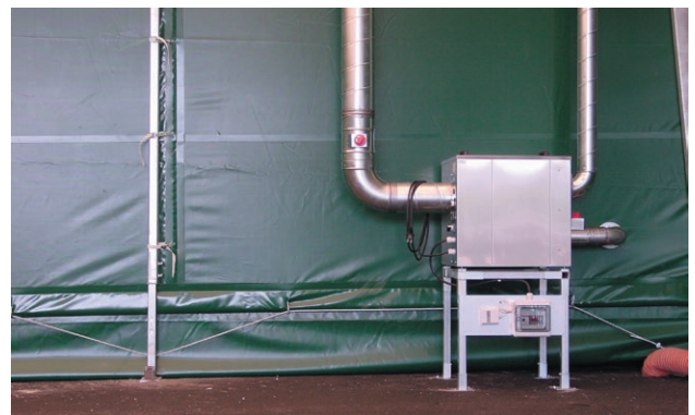
Un déshumidificateur de DST de type Recusorb DR-40 installé dans un hall de stockage en PVC

Avec l'aide d'un déshumidificateur, on peut contrôler le taux d'humidité dans un hall de stockage en PVC. Si l'humidité relative ne dépasse pas environ 70 % HR, on échappe aux problèmes des moisissures. Pour éviter la rouille, il faut que l'humidité de l'air reste en dessous de 50 % HR. En contrôlant le taux d'humidité dans la plage qui convient, on peut s'assurer que la qualité des marchandises entreposées sera maintenue.