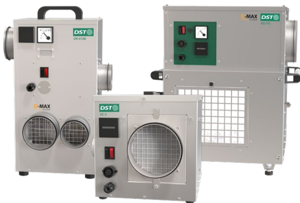
Déshumidificateurs en acier inoxydable de DST. De gauche à droite DR-010B, DC-5, AQ-31L