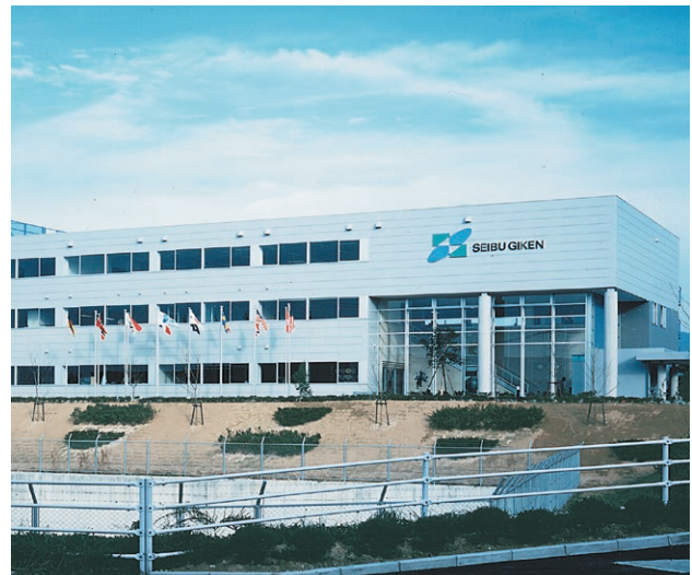
Siège social de Seibu Giken à Fukuoka, Japon