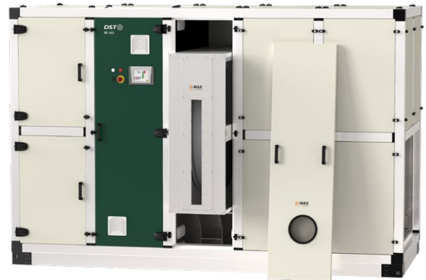
Flexisorb unité RF-102

La société suédoise Seibu Giken DST AB est une filiale de la société japonaise Seibu Giken Co Ltd. Seibu Giken fabrique, entre autres, des rotors de déshumidification, des rotors à COB et des échangeurs thermiques.